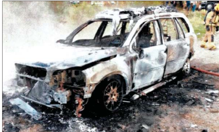
TOTALSKADD: Bilen, ein Volvo XC-90 2003-modell, blei fullstendig øydelagd av brannen. Bilen hadde ein verdi i overkant av 90.000 kroner, meiner forsikrings-selskapet.