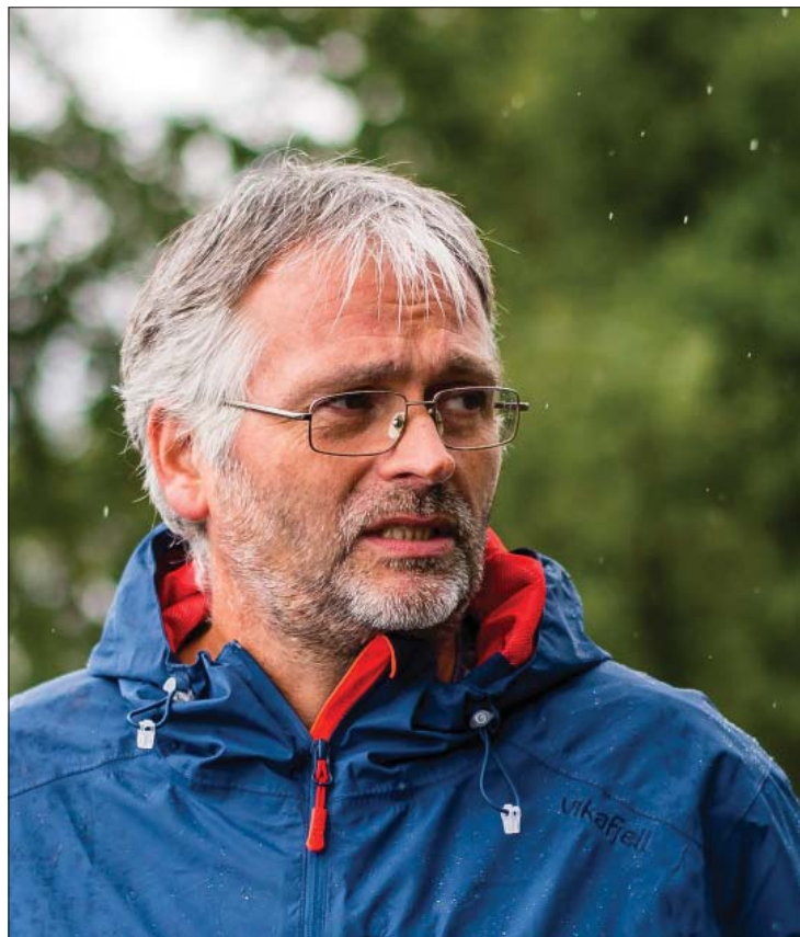
KAN IKKJE TRU DET: Sæther legg ikkje skjul på at det er vondt å ikkje bli trudd. Han er klar på at han er utan skuld i saka.

Antibac både i hanskerommet på bilen og i kona si veske på golvet.