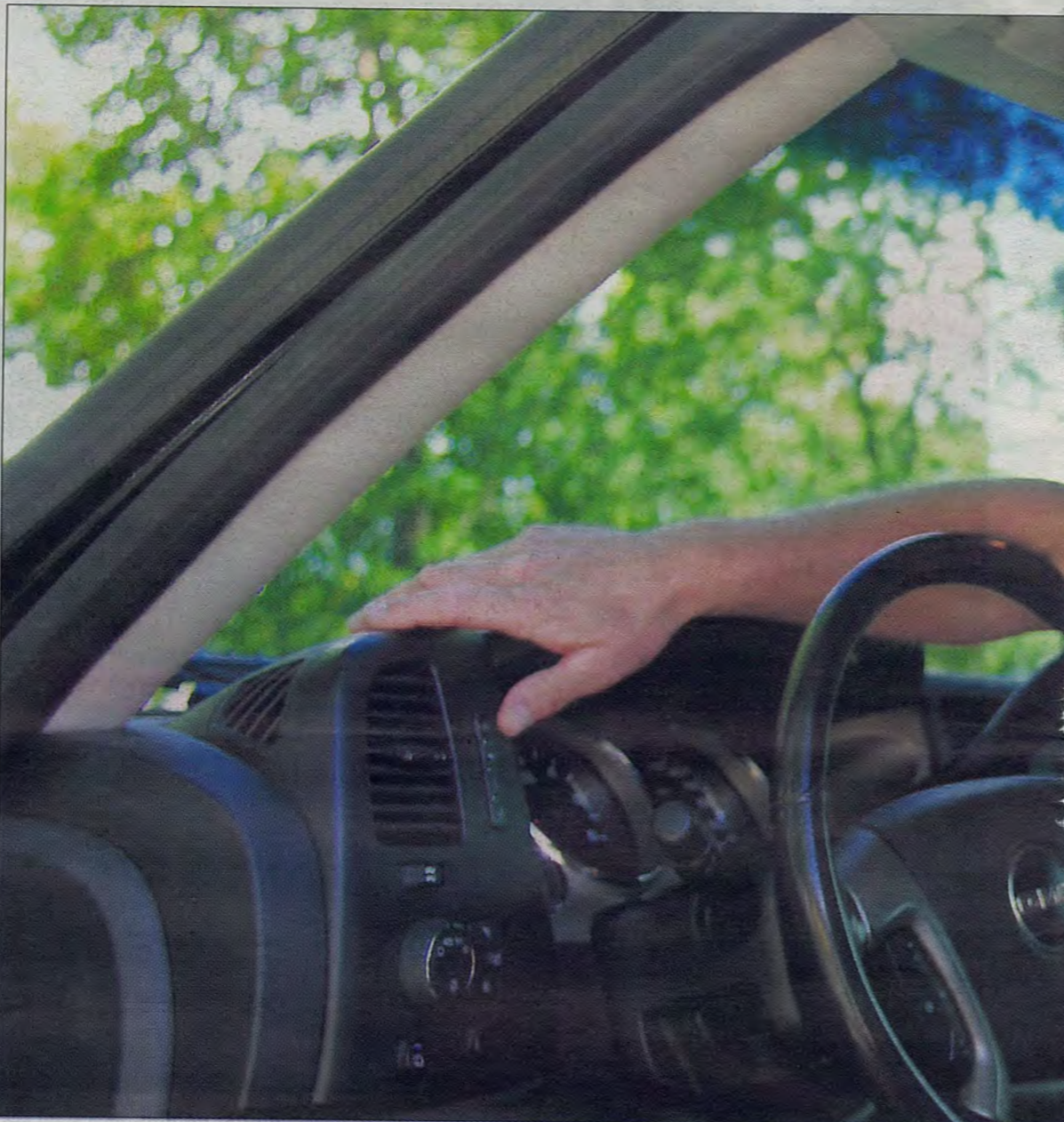
IKKE BLID: – Jeg synes straffene er for milde. De viser i praksis at det er greit å fortsette uten HMS og sertifikater, og me